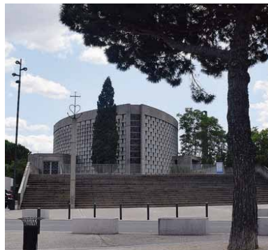
L'église Saint-Dominique au Chemin bas d'Avignon. JPM