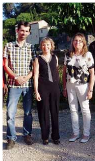
Les organisateurs travaillent d'arrache-pied à la mise en place d'un festival qui se déroulera autour de la musique, la danse et le sport. A.L.